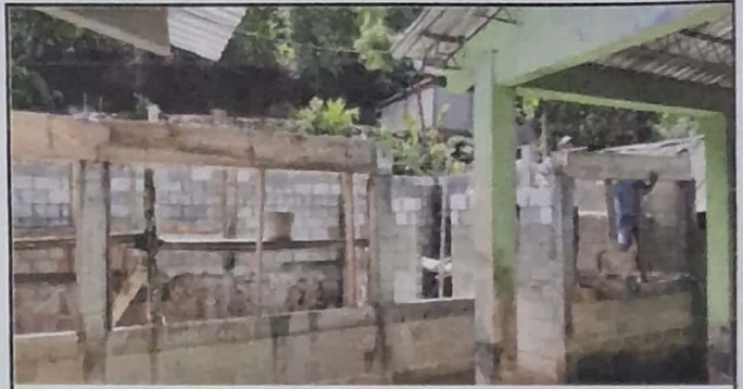
REHABILITACION DE MODULOS 2