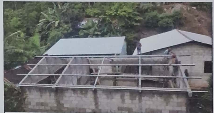
MODULO 2: Rehabilitacion de modulos 2