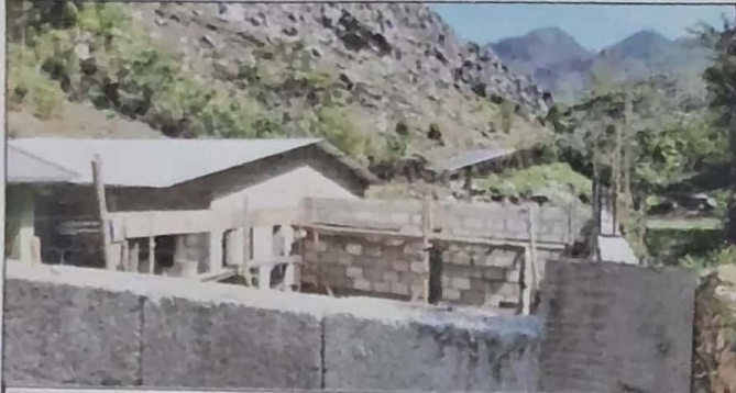
REHABILITACION DE MODULO 2: