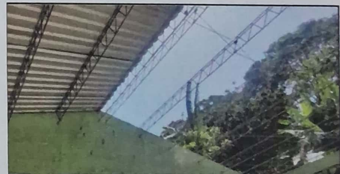
MODULO 1: Cambio de techo de Modulo 1

Observación: Si es necesario se pueden agregar hojas adicionales y actualizar el número de hojas.