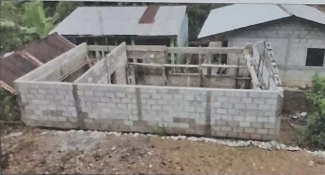
MODULO 2: Rehabilitacion de modulo 2